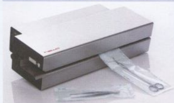
HM 780 DC-V