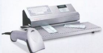
HM 880 DC-V